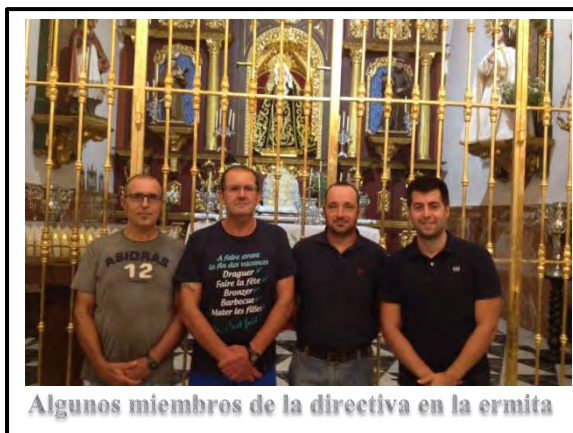
Algunos miembros de la directiva en la ermita